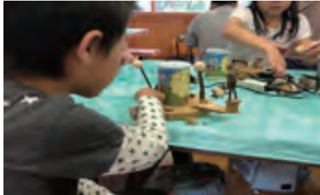
写真 3 貯金箱づくり