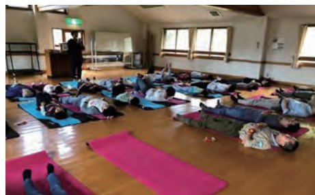
写真 5 こころのおべんきょう 呼吸法