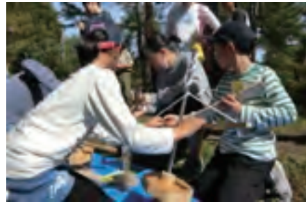
写真 2 火おこし体験