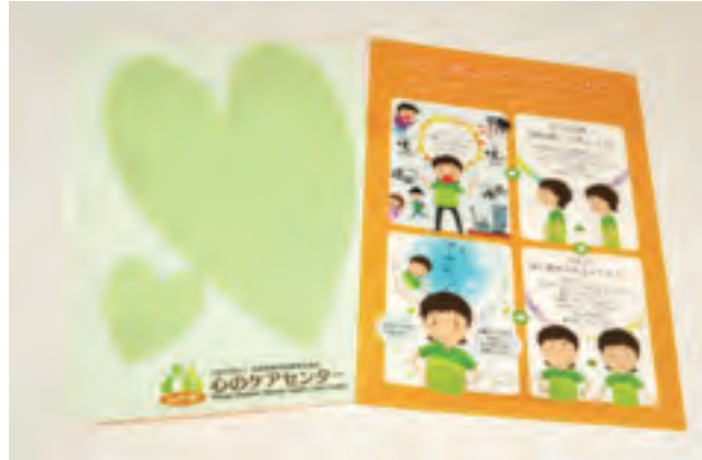
図1 セルフケア法イラスト付クリアファイル

平成24年度より、震災以降に懸念されるPTSD、アルコール関連問題、うつ、不眠などのパンフレットを常備し、各地域支援課の支援活動に活用した。平成30年度もこれまでに作成したパンフレットを各地域支援課の活動で活用すると共に、使用頻度の高いパンフレットの増刷を行った。また、研修会や講演会で資料を収納するクリアファイルを新規に作成した。研修参加者を通し、身近な人に啓発していただくことを期待して簡単なセルフケア法のイラストをプリントした。(図1)