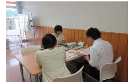
気仙沼地域センターで案を練る