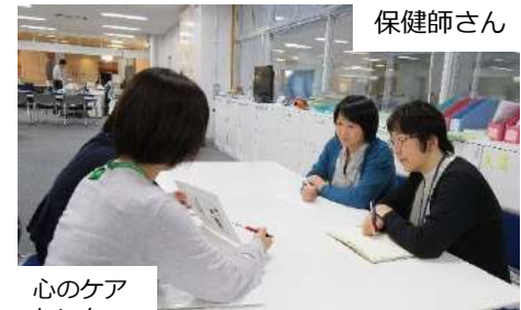
心のケアセンター