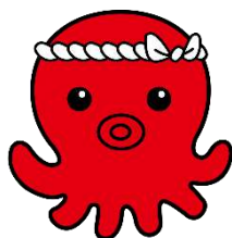
南三陸町のキャラクター オクトパス君